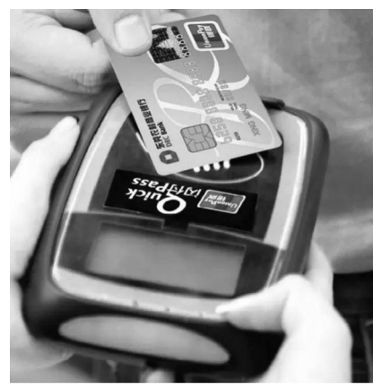
银联联合成员机构为持卡人提供失卡保障服务,在满足补偿条件的情况下,持卡人挂失前72小时内被盗刷消费金额在一定额度内可获补偿。

对于持卡人的担忧,银联公告称,小额免密免签商户可信,额度可控,风险可控,为增强持卡人信用卡信心,对因卡片失窃、遗失等原因造成的盗刷损失,由中国