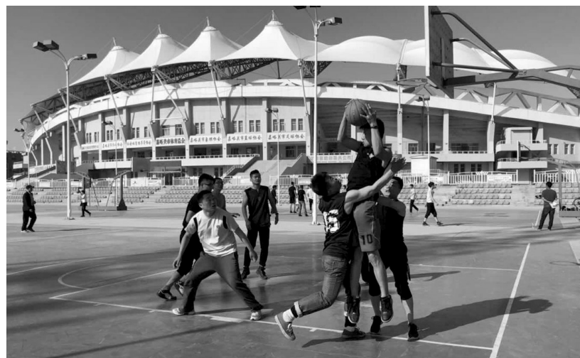
近日,宏兴股份不锈钢分公司冷轧二分厂甲班团支部举办了一场以“青春无畏,逐梦扬威”为主题的3v3篮球比赛。共有3支队伍参赛,比赛采用淘汰赛制共进行4场比赛。经过参赛队员奋勇拼搏,最终3队赢得了第一名。