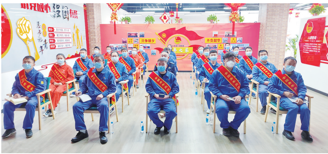
集团公司团员青年代表收看大会开幕盛况。