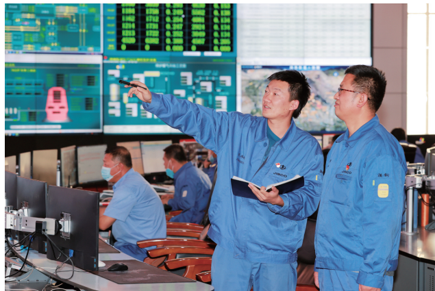
酒钢职工深受大会精神鼓舞,全力做好本职工作。