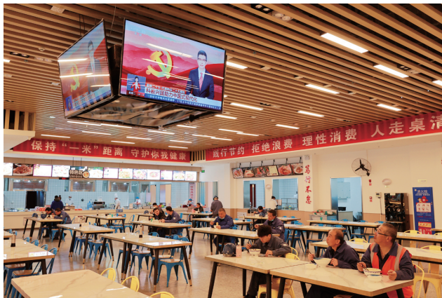
酒钢职工食堂播放大会相关新闻报道。