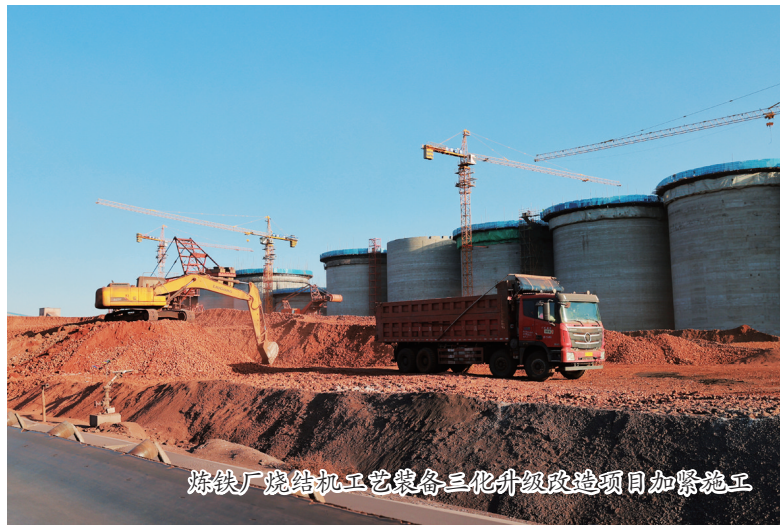
炼铁厂烧结机工艺装备三化升级改造项目加紧施工

人勤春来早,建设正当时。今年一季度,集团公司以党的二十大精神为指引,以开局就是决战、起步就是冲刺的姿态落实省委省政府“大抓项目、抓大项目”部署,加快推进省列重大项目建设。