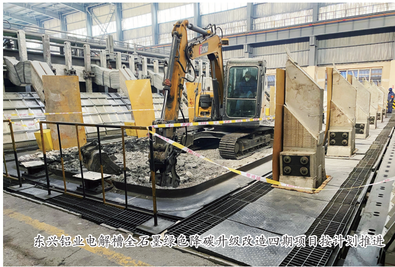
东兴铝业电解槽全石墨绿色降碳升级改造四期项目按计划推进