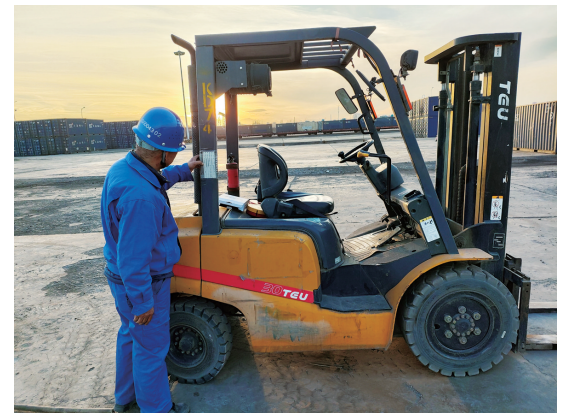
临近春节,物流公司嘉峪关多式联运物流园组织专人对园区内电气设备、电气线路、供电配置及作业现场集装箱正面吊、叉车、装载机等进行检查,及时处理发现的问题,进一步筑牢安全作业防线。