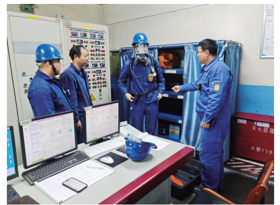
近日,宏兴股份公司炼轧厂二高线作业区组织开展空气呼吸器使用培训,进一步提高了职工的安全技能和救援能力。

2024年,该公司将凝心聚力,抢抓机遇,奋勇拼搏,以更高标准、更严要求、更实作风做好各项工作,全力打造世界一流铝企业。