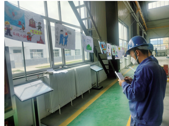
东兴嘉信新材料公司举办安全漫画展。