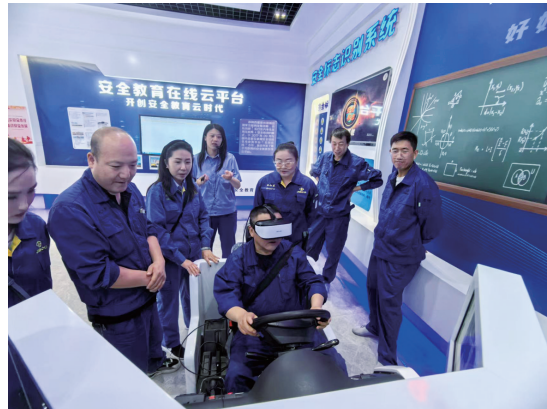
产成品服务分公司开展VR体验活动。