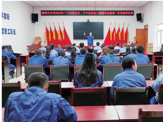
陇西分公司举办安全主题演讲比赛。