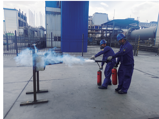
听昊达公司开展火灾应急演练。杜艳斌 摄