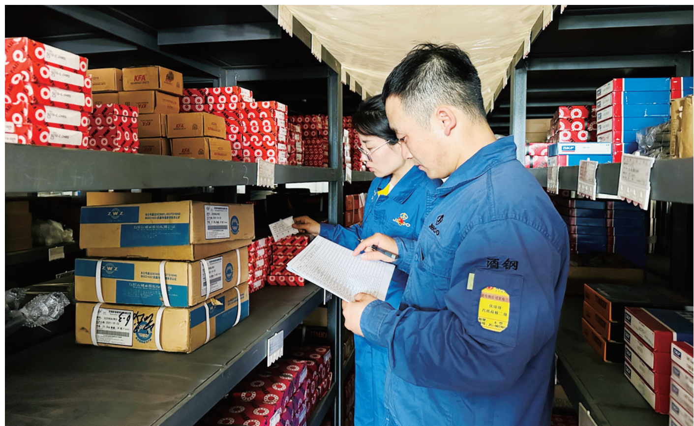
日前,宏晟电热公司铝电保障作业区对库存现有库存进行大盘点,为4号机组A级检修准备蓄热元件1133块、催化剂133.5立方米、屏耳管排357件、油品125桶,充分做好检修服务准备工作。