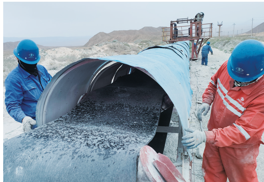
日前,宏兴股份西沟矿碎矿运输作业区对B6胶带进行更换,将计划56小时的任务提前3小时完成,为确保胶带运输安全顺利奠定了基础。

“关山初度尘未洗,策马扬鞭再奋蹄。”东兴嘉宇新材料公司将继续以不妥协、不放弃、不服输的精气神解决项目土建、安装、调试过程中的难题,为年产量30万吨的投产目标,再鼓干劲、再强举措,确保项目按期完工,为企业高质量发展贡献力量。