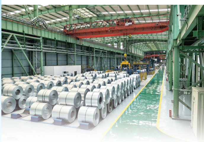
碳钢板厂酸洗作业区厂房