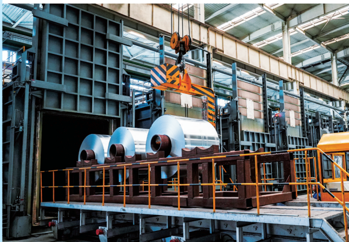
东兴嘉宇新材料公司退火工艺优化试验现场