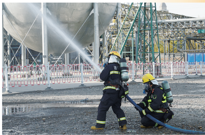
宏兴股份动力厂近日开展球罐着火事故应急演练,检验应急预案的实用性和可操作性,进一步增强各应急工作组之间的协同作战能力,为今后应急处置工作积累了宝贵经验。

下一步,该公司将进一步强化责任落实,持续完善消防安全管理制度,定期对所属区域开展消防安全检查,确保及时发现并消除火灾隐患;不断加强消防安全教育,增强职工消防安全意识,提高职工应急处置能力,以实际行动践行消防安全承诺,筑牢“防火墙”,防患于未“燃”。