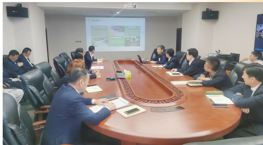
日前,上海华昌源公司开展消防安全宣传活动,组织职工进行2024年全国消防宣传月专题学习。会上,全体职工集体学习了《中华人民共和国消防法》《消防安全责任制实施办法》等内容,消防意识进一步增强。