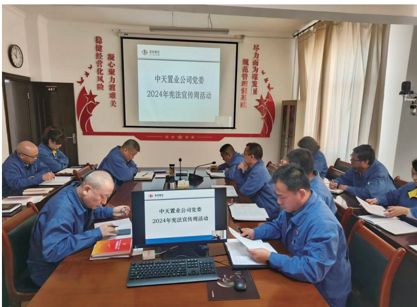
中天置业公司开展宪法宣传活动,进一步增强职工宪法意识。

天工矿业公司组织职工观看宪法宣传片,通过生动案例分析了解宪法在日常生活中的体现与应用,促使职工对宪法有更直观、更深刻的理解。职工们表示,将在今后的工作和生活中维护宪法权威,履行宪法使命,为法治社会建设贡献力量。