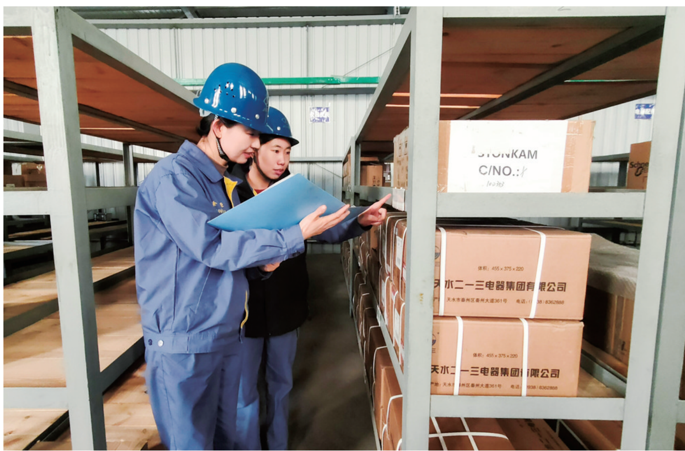
近日,东兴铝业公司嘉峪关保障作业区开展机旁库管理专项整治工作,仓储管理员全面排查各作业区机旁库物资存放场所,15个作业区、78间库房,共6389项物资得到系统规整与优化配置。目前,各作业区物资已全部分层分类定置摆放。