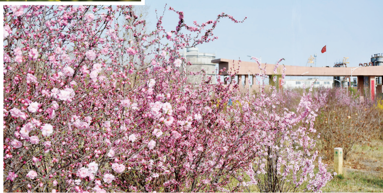
《浪漫邂逅》