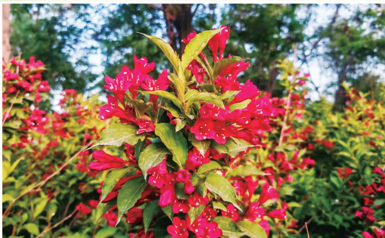
《花团锦簇》