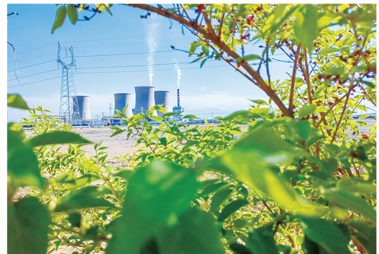
《一角一隅一风景》