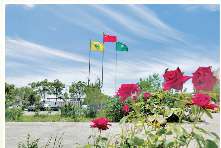
《风和日丽》