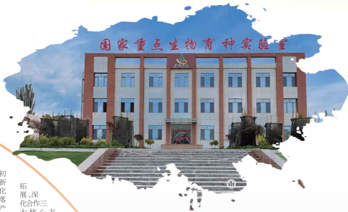
图1: 敦煌种业国家重点生物育种实验室。

1998年12月,敦煌种业公司成立。 2003年12月,敦煌种业7500万A股在上海证券交易所首次公开发行。 2008年12月,敦煌种业股票跻身2008年十大牛股。 2012年5月,敦煌种业研究院成立。 2014年7月,敦煌种业院士专家工作站成立。 2017年5月,合并新设敦煌种业玉米种子分公司;原各公司蔬菜业务人员、基地和资源整合在酒泉设立敦煌种业蔬菜种苗科技有限公司。 2024年7月,敦煌种业第一控股股东正式变更为酒泉钢铁(集团)有限责任公司。