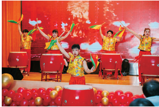
润源公司举办迎新春联欢晚会。