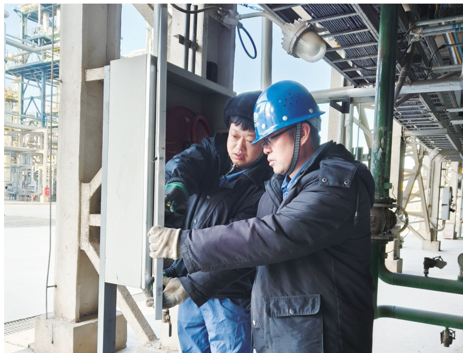
近日,宏汇公司制加氢作业区开展消防设施专项排查,重点更换消防栓箱体破损玻璃、维修灭火器开关卡滞的合页等,提升作业区消防设施的可靠性,为后续安全生产工作奠定坚实基础。

截至目前,19部实操视频已覆盖该公司全部生产班组,在职工中形成了“学标准、用标准、守标准”的良好氛围。下一步,东兴嘉信新材料公司将根据生产工艺优化情况持续更新视频库,拓展应急处置、设备维保等专项内容,深化可视化安全管理创新实践,推动安全理念入脑入心,为企业高质量发展筑牢安全屏障。