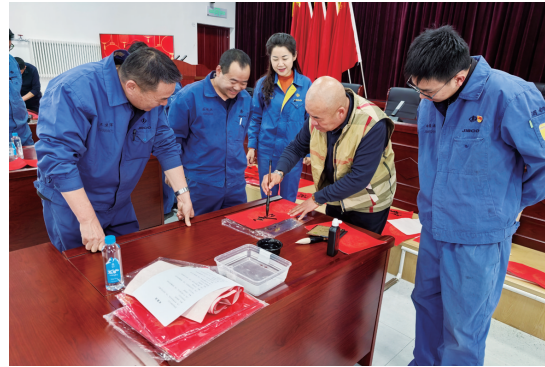
宏兴宏博新材料公司开展送春联活动。