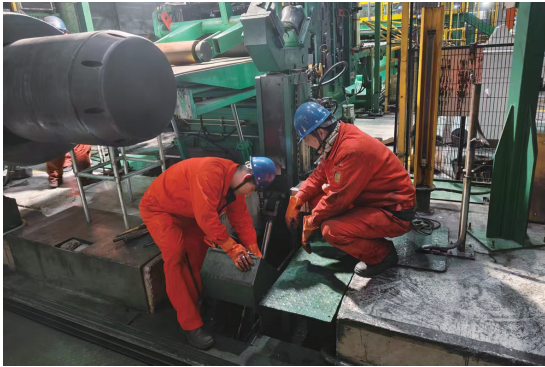
宏兴股份检修工程部做好节前设备强化工作。