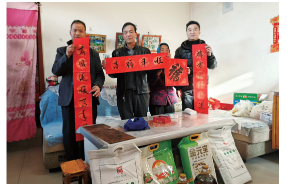
酒钢驻村工作队慰问古浪县富民新村关爱对象。