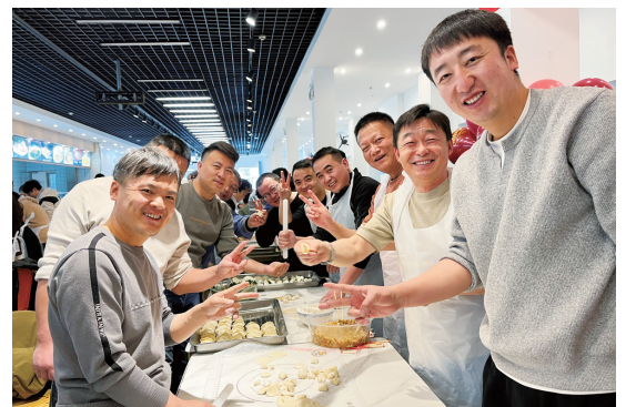
宏兴股份选矿厂开展包饺子活动。

宏兴股份镜铁山矿召开“情暖冬日、共叙未来”节前慰问座谈会。2025年入职大学生依次发言,分享了近半年以来工作中的成长与收获。此次座谈会不仅搭建了企业与大学生职工、新老职工之间的沟通桥梁,更传递了该矿对青年人才的重视与关